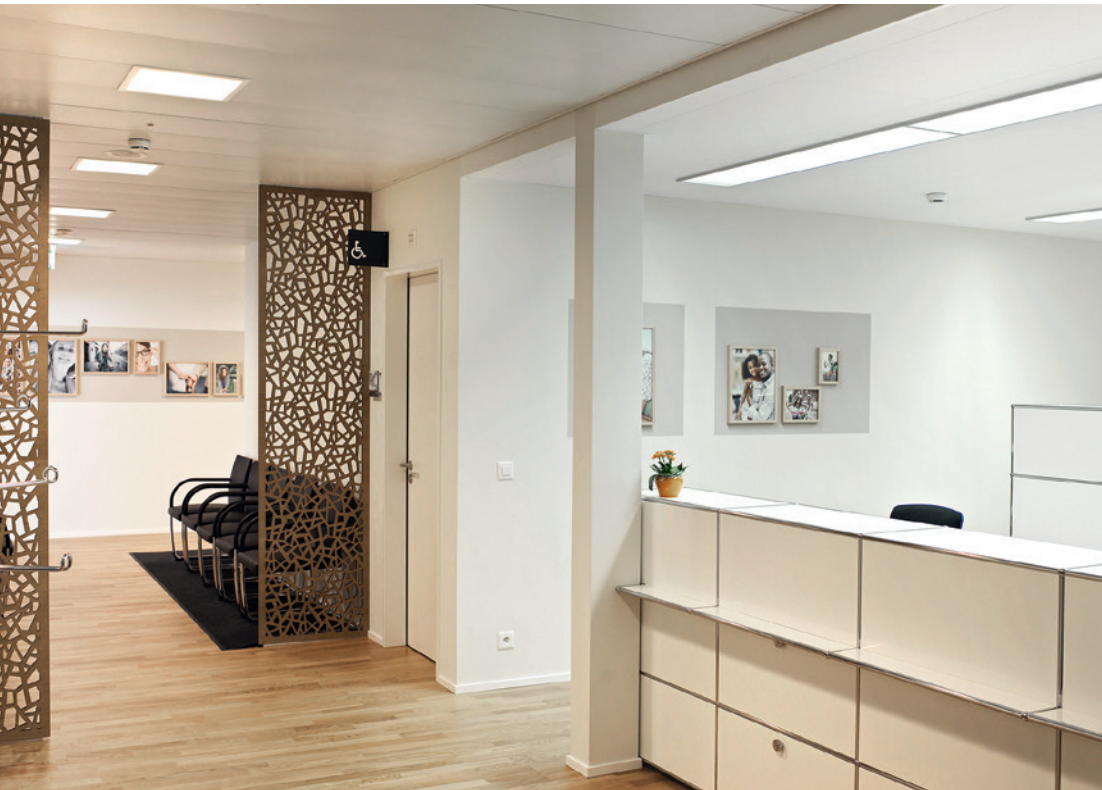
Ansprechendes Ambiente in allen öffentlichen Räumlichkeiten für die Patientinnen und Patienten sowie Mitarbeitenden (Empfang Physiotherapie)