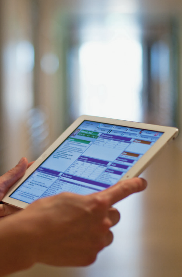
Ständiger Begleiter und integraler Behandlungspartner: Tablet und KIS-Ärztecockpit

Es folgten Produktentwicklung, Spezifikation, Installation technischer Voraussetzungen, Programmierung, Customizing, Test- und Pilotphase, Optimierung, Stabilisierung, Abschlussevaluation der Anwender und deren Schulung sowie Produktivstart des Ärztecockpits im gesamten Spital symbolisch als »Weihnachtsgeschenk«.