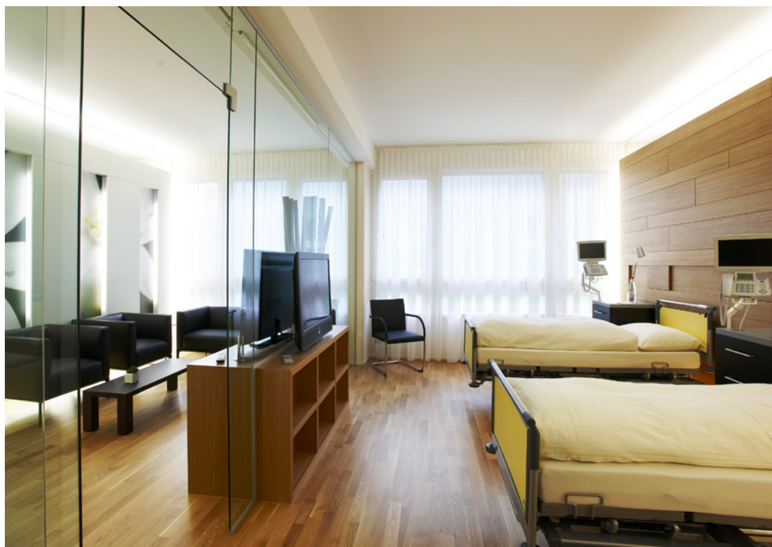
Exzellente Zimmer: wohnlich und funktional zugleich mit hotelhaftem Wohlfühlfaktor

Im vergangenen Jahr 2014 wurden zahlreiche Projekte erfolgreich realisiert: die Online-Verordnung in der Radiologie, diverse Schulungen und