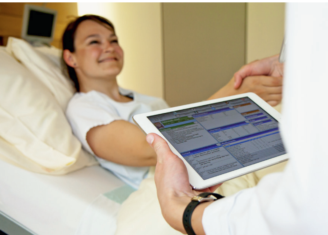
Ärztecockpit: alle KIS-Patienteninformationen auf einen Blick, jederzeit aktuell und überall verfügbar.

Im laufenden Jahr stehen schliesslich das erweiterte strukturierte Berichtswesen, das Dokumentationsmanagement, die Archivierung und das Zuweisportal mit frei praktizierenden Ärztinnen und Ärzten sowie die Online-Verordnung